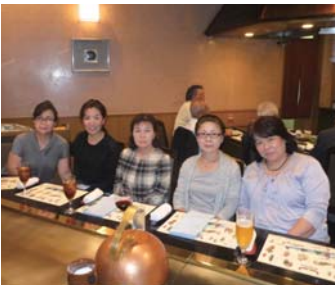
ステーキ「はま」にて