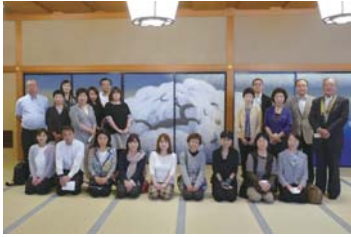
成田山新勝寺 光輪閣 大山忠作画伯作「日月春秋」の襖絵 にて記念撮影

毎年恒例になっている課外研修会を9月14日に成田山新勝寺正式参拝と成田空港施設見学で開催いたしました。 成田山新勝寺では各会員企業の繁栄を祈願した他、光輪閣において大山忠作画伯作「日月春秋」の襖絵などを見学しました。 次に成田空港では制限区域内にある旧管制塔やA滑走路からの航空機の離着陸をはじめ2015年4月にオープンした第3ターミナル（LCC用）を見学し成田空港の変貌を学ぶことができました。今回も日頃体験できない研修となり参加した部会員より「来年も是非参加したい」との声がありました。