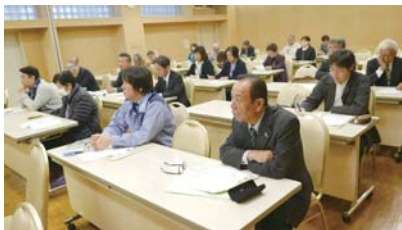
支部連合別税務研修会受講風景

国税庁が毎年開催している税を考える週間（11月11日～17日）は、国民各層により税の仕組みや目的を考慮してもらう為、各種行事を全国的に実施しているものであります。当会においても地区別税務研修会・女性部会による税を考える週間PR活動等を積極的に実施し税知識の普及に努めました。地区別税務研修会には、今年法人会にご加入された新入会員の皆様にも多数参加頂き、会員相互の交流の場として参加者より好評を頂きました。