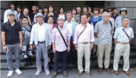
築地場外市場にて

毎年好評を頂いている千葉地区会員交流会を今年 は築地場外市場見学と人気のある劇団四季ミュージ カル「ライオンキング」鑑賞で開催しました。当日 は天候にも恵まれ移転が近い築地場外市場の現況を 見学し、劇団四季ミュージカル「ライオンキング」 鑑賞では何度見ても感動する本場ブロードウェイさ ながらのミュージカルを鑑賞することが出来ました。 参加者より来年も是非実施してほしいとの声があり ました。