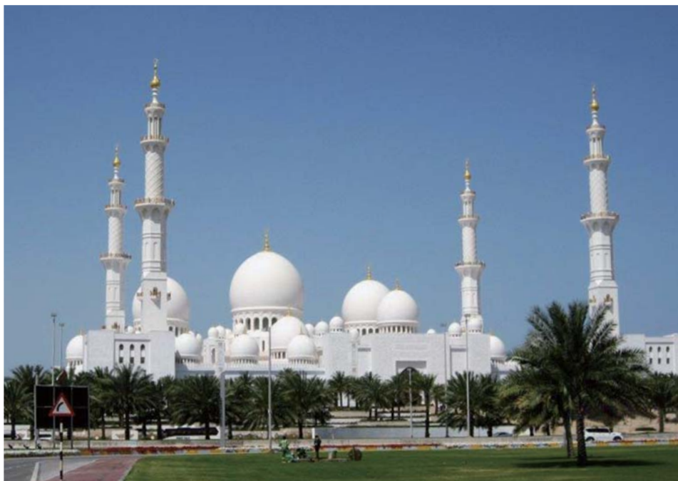
シェイク・ザイド・グランド・モスク(アブダビ)