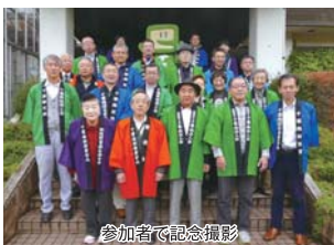
参加者で記念撮影