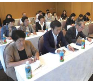
研修中の女性部会員

第三部 「会員交流会」では、会員同士講演会等の話に花が咲き、時間の経つのも忘れる程、和やかな雰囲気の家となりました。