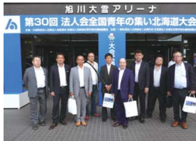
大会会場前にて記念撮影