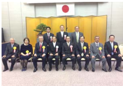
納税表彰式で受彰者記念撮影