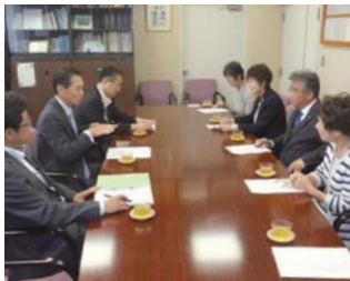
取材中の広報委員

新潟県上越市です。新潟県の南西部に位置し、日本海に面した平野にあり、関川とその支流からなる扇状地となつているところ。海岸沿いは砂丘、その内陸部に水田が広がります。上越市の港である直江津港の周辺は電気、化学工業の臨海工業地帯です。上越市は日本海側ですので、冬になれば特有の雪やみぞれを伴う北西の強い季節風が吹き、山間部は1階の屋根近くまで届くような多くの積雪があるなど荒天の日がほとんどで、冬に閉じれば太平洋側のお天気続きとは正反対なところ。また、その分、食べ物などは、豊富な雪解け水のおかげでコシヒカリなどのお米、地元の造り酒屋の日本酒がおいしいです。また、地元ゆかりの戦国武将に上杉謙信、直江兼次がいます。