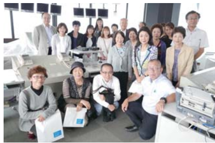
成田空港 旧管制塔にて記念撮影

9月9日(金)旭川大雪アリーナで開催された第30回全法連全国青年の集い北海道大会に参加しました。大会では大会式典等に参加し、例年行われてる租税教室の優秀事業の発表やスキージャンプ葛西紀明氏の記念講演など盛りだくさんイベントがあり有意義な大会参加となりました。 2日目は舞台を札幌に移し、中央卸売市場の場外市場見学、北海道名物、ジンギスカンに舌鼓し参加者全員北海道を満喫することができました。