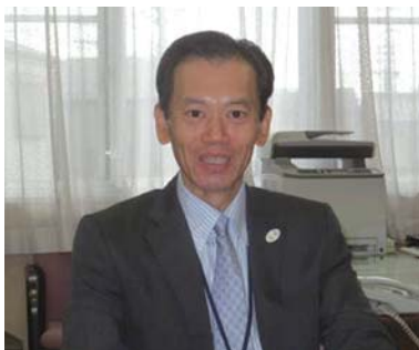
取材中の小山千葉南税務署長