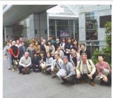
劇団四季劇場にて記念撮影