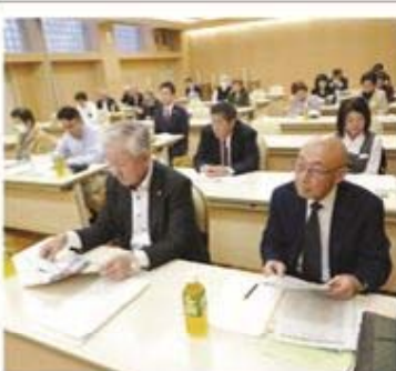
支部連合別税務研修会受講風景

地区別税務研修会には、今年も多数のご参加頂き、会員相互の交流の場として参加者より好評を頂きました。