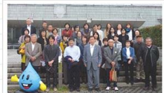
東京都水の科学館にて記念撮影

去る10月24日、第4支部連合（五井地区）では会員相互の親睦と法人会活動のPRを兼ね、劇団四季「キャッツ」ミュージカル鑑賞を主とした研修旅行を開催しました。当日は水と水道への興味を深める体感型ミュージアム「東京都水の科学館」見学と劇団四季ミュージカル「キャッツ」鑑賞の豪華2本立ての企画により日頃交流できない会員同士が交流することができ、参加者一同大変有意義な1日となりました。