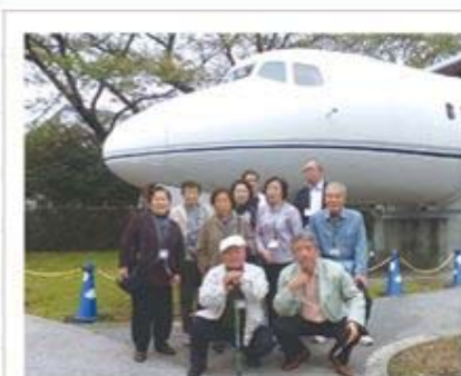
調布航空宇宙センターにて記念撮影

去る10月16日、第3支部連合では会員相互の親睦と法人会活動のPRを兼ね、調布航空宇宙センター見学と深大寺参拝を主とした研修旅行を開催しました。調布航空宇宙センターでは、社会のニーズに対応した航空技術や宇宙開発を発展させるための先行的な研究開発について担当職員より説明を聞くことができ大変有意義な交流会となりました。又次に訪れた深大寺では武蔵野の風情を色濃く残す古刹を参拝し、門前で深大寺そばを堪能。その後、サントリー武蔵野ブルワリーで出来たてビールを堪能し参加者一同大変有意義な1日となりました。