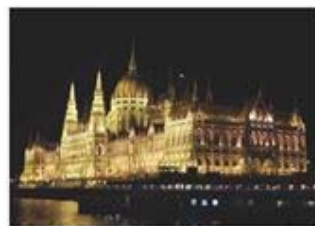
表紙の言葉 国会議事堂 夜景(ブダペスト)

ご覧いただいている写真はブダペスト ハンガリーの国会議事堂の夜景です。旅行ガイドの情報では素晴らしい夜景がブダペストのナイトクルーズでは観ることができるとのことでしたが、期待を裏切らない素晴らしい夜景が見ることができます。ドナウ川ナイトクルーズでは、ライトアップされたこの国会議事堂をはじめマーチャーシュ教会・王宮・漁夫の誓・くさり橋等数、多くの景観が旅行者を楽しませてくれます。