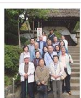
深大寺にて記念撮影