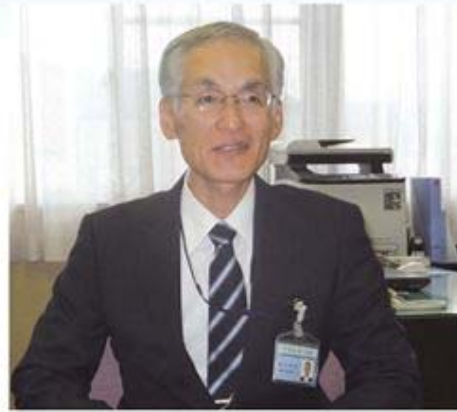
取材中の鈴木千葉南税務署長