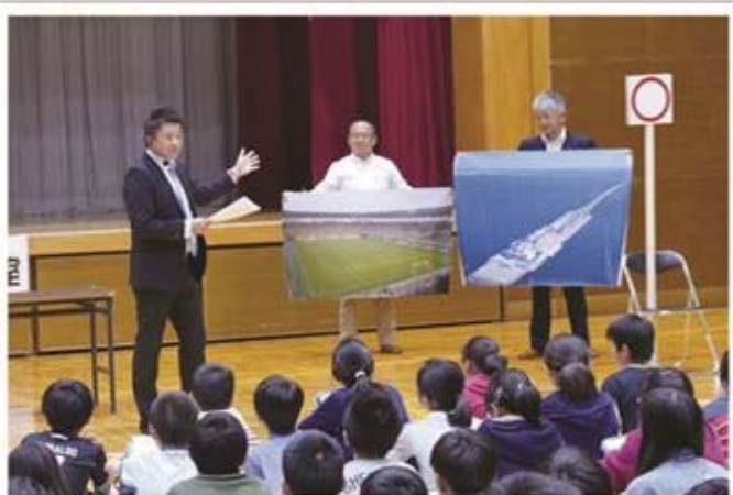
研修中の金沢小学校の児童