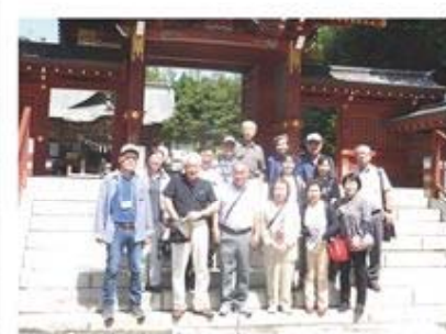
秩父神社にて記念撮影

去る9月5日、第5支部連合（姉崎地区）では会員相互の親睦と法人会PRを兼ね、秩父夜祭で知られる秩父神社と関東のパワースポット・商売繁盛で有名な三峯神社参拝を主とした交流会を開催しました。