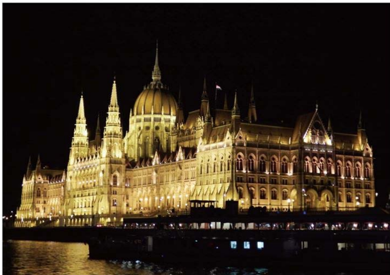
国会議事堂 夜景 (ブダベスト)