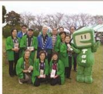
参加者で記念撮影