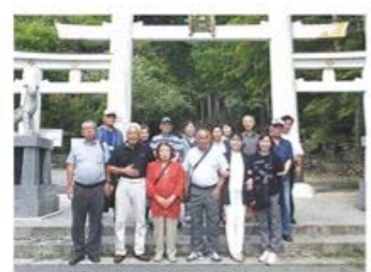
三峯神社にて記念撮影