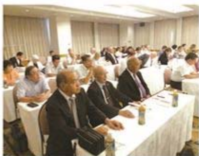
研修中の役員の方々