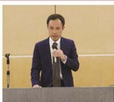
税務研修会講師の 千葉南税務署 清宮審理担当上席調査官