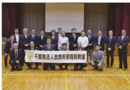
参加者全員で記念撮影