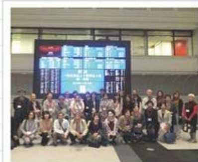
東証Arrowsにて記念撮影

去る10月18日、第1・第2支部連合（千葉地区）では会員相互の親睦と法人会活動のPRを兼ね、劇団四季「アラジン」ミュージカル鑑賞を主とした交流会研修旅行を開催しました。東証Arrowsでは経済や証券取引の仕組みを勉強し、その後劇団四季ミュージカル「アラジン」を鑑賞しました。日頃交流できない会員同士が交流会を通して交流することができ、参加者一同大変有意義な1日となりました。