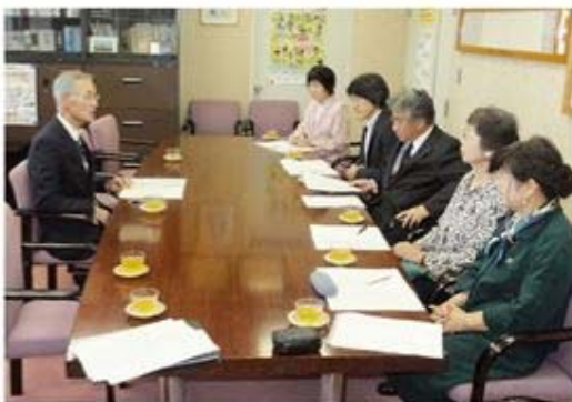
取材中の広報委員

千葉南法人会の皆様には、租税教室や税に関する絵はがきコンクールなどの租税教育活動のほか、タクシーにマグネットシートを装着してのICT申告・マイナンバー記載のPR活動、市原市農林業祭りでの広報活動などにご尽力いただいております。感謝申し上げます。今後も法人会の皆様には、より一層充実した事業活動を展開されますとともに、税の良き理解者として引き続きお力添えを賜りますようお願い申し上げます。