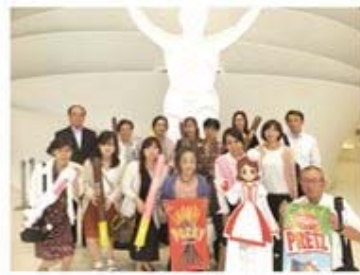
グリコアイスストにて

本年はグリコアイスストにおいて社名にもなっている栄養素「グリコゲン」を使用したグリコの健康菓子の製造工程について見学しました。当日はグリコ見学後コレド室町にてアートアクリウム2018の見学も併せて開催し、参加した部会員より「来年も是非参加したい」との声がありました。