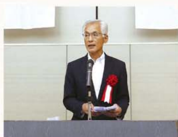
鈴木千葉南税務署長挨拶