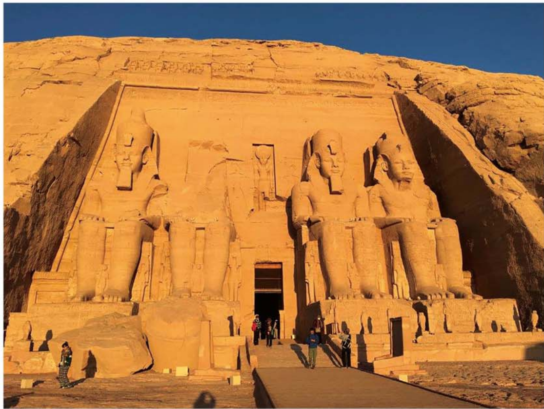
アブシンベル神殿（エジプト）