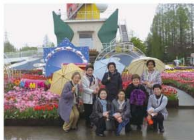
となみチューリップフェア