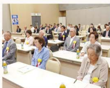
出席頂いた法人会員の方々