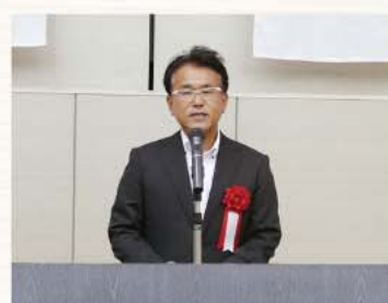
篠田市原市財政部長挨拶