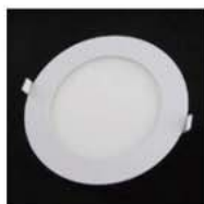
薄型ダウンライト