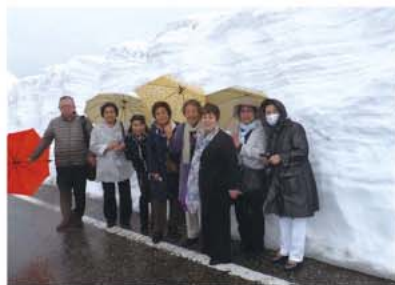
立山黒部アルペンルート雪の大谷にて