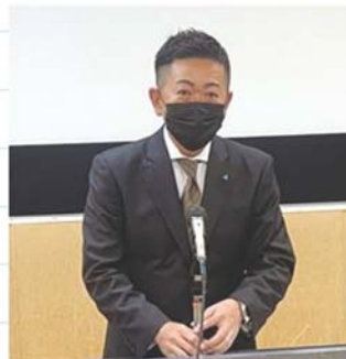
小河原新青年部会長挨拶