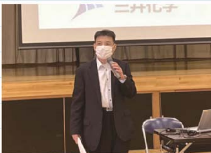
説明中の三井化学(株) 市原工場総務部総務グループ 長岩主席