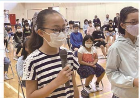
謝辞中の市原市立青葉台小学校児童代表