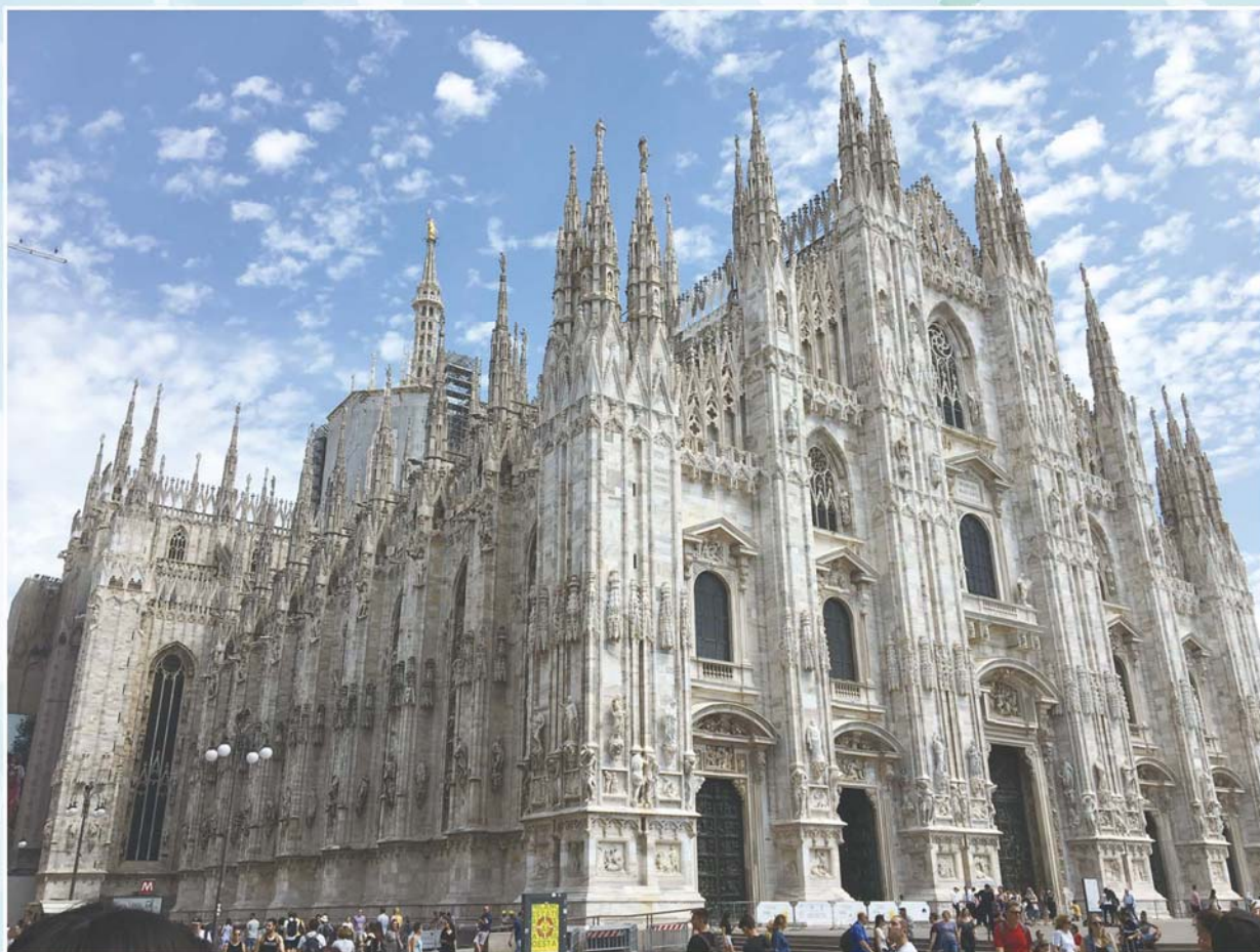
ミラノドゥオーモ (イタリア)