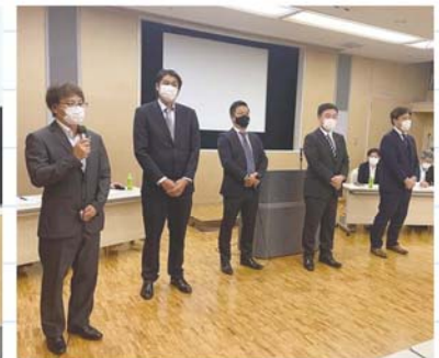
新入青年部会員挨拶