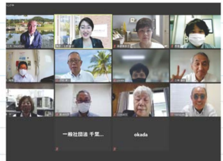
Zoomの使い方セミナー記念撮影