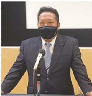
本多青年部会長挨拶