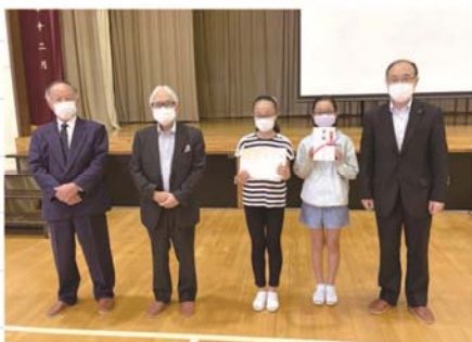
市原市立青葉台小学校へ青少年育成支援品贈