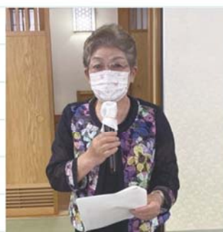
増田監事監査報告