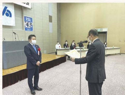
法人会功労者表彰式風景