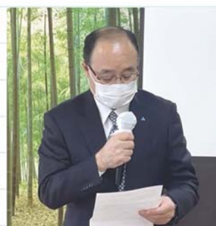
麻薙千葉南法人会会長挨拶