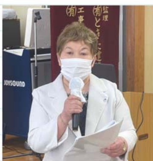
中村女性部会長挨拶