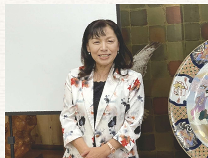
高澤千葉南間税会女性部会長挨拶