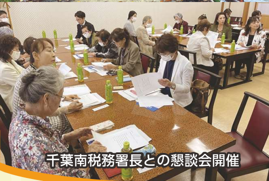
千葉南税務署長との懇談会開催