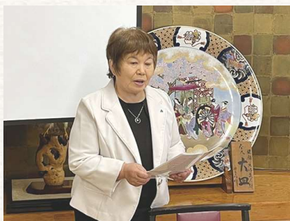
中村千葉南法人会女性部会長挨拶