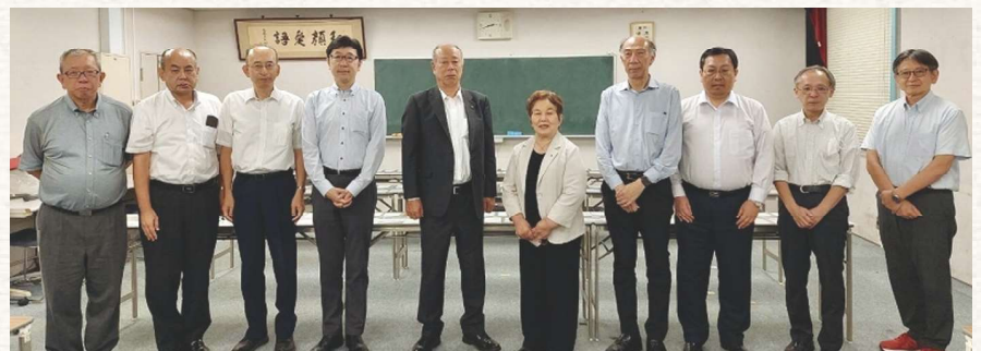
参加者全員で記念撮影