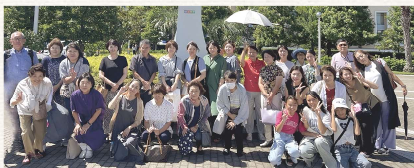
参加者全員で記念撮影