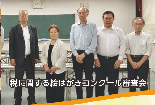
税に関する絵はがきコンクール審査会