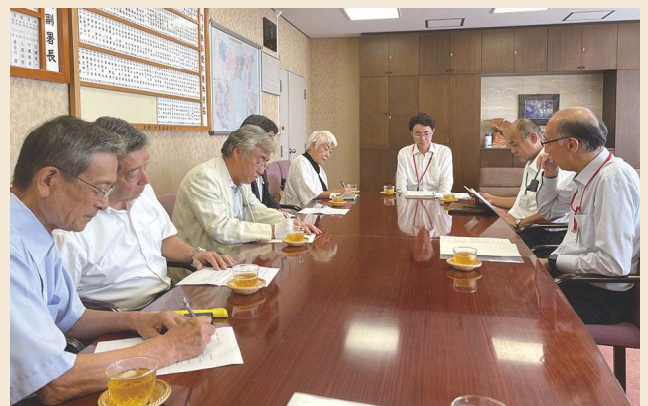
インタビュー風景