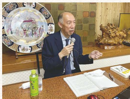
懇談会中の生田千葉南税務署長