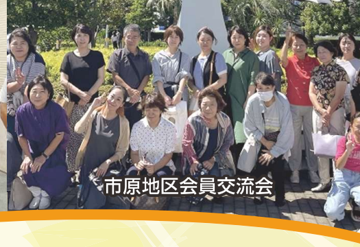
市原地区会員交流会