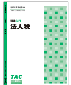
オリジナルテキスト (演習問題付き)